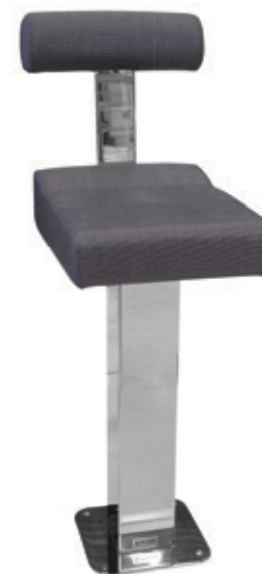
P 230 Q Supporto rettangolare Rectangular support